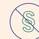
Overtrædelse af arbejdstagerrettigheder