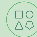
Diversitet i ledelser