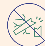
Skader på miljø og klima