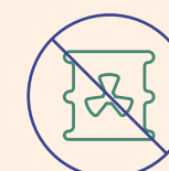
Kemiske og biologiske våben