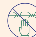
Overtrædelse af menneskerettigheder